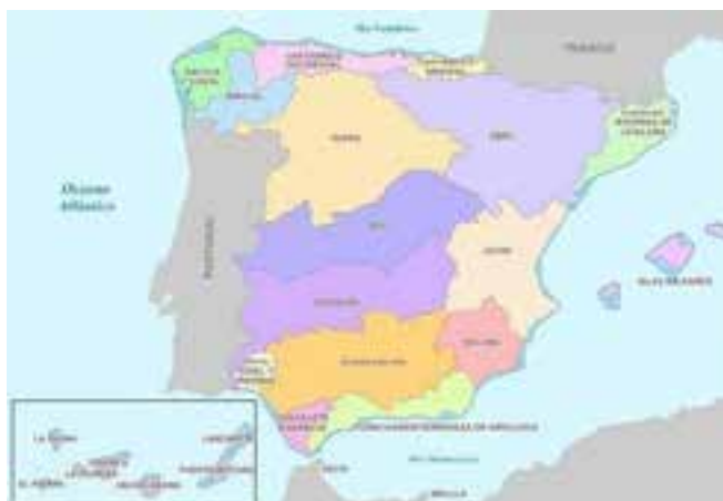
Mapa 1. Demarcaciones hidrográficas.

Sin embargo, este proceso ya se está produciendo en las últimas dos décadas y, además, en todas las demarcaciones hidrográficas.